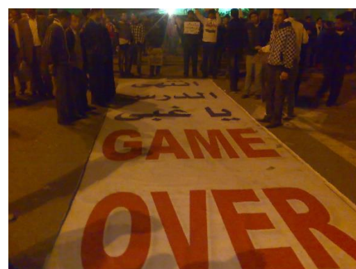
« La leçon est finie, abruti. Game over »

Pendant ce temps-là Frédérique Vidal a décidé de faire la tournée des facs du Grand ouest. La ministre est d'ailleurs attendue à Angers pendant deux jours, occasion pour le comité de mobilisation de lui réserver un accueil aux petits oignons . L'Université d'Angers est une des universités les moins dotées de France, qui sont déjà en moyenne peu dotées : en Anjou, « ce sont plus de 700 postes, 7 millions d'euros et 500 logements étudiants [qui font défaut] pour atteindre la dotation moyenne des universités en